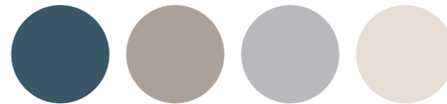
Paleta cromática sencilla

La paleta cromática debe basarse en vuestra personalidad, adaptado a un color que os represente.