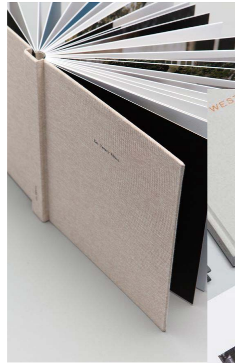
Portada de tela y tapa dura