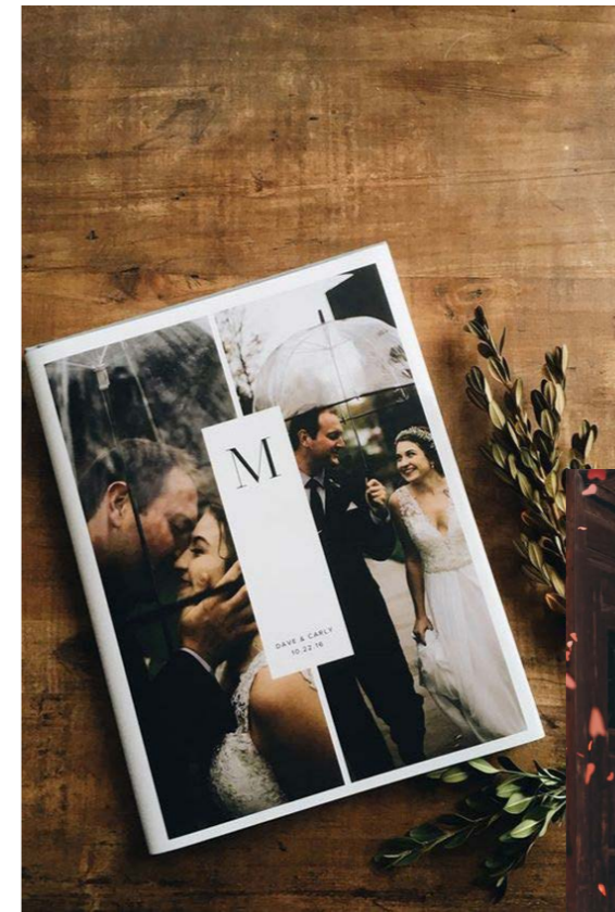
Formato vertical (DINA4)

Las fotos serán más fácilmente adaptables en un formato vertical que cuadrado.