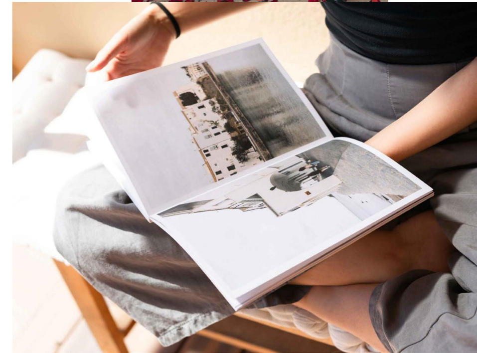
Papel blanco roto satinado mínimo 200g Las fotos se verán con mayor calidad y más fieles al color real.

¡Las fotos darán el color a todo el libro!