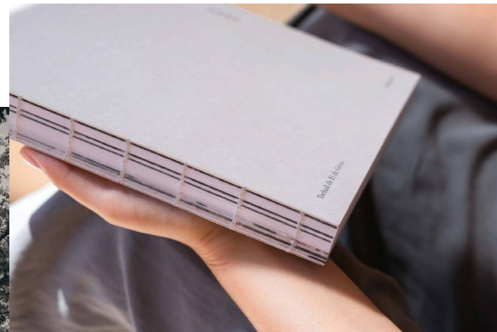
Cosido en pliegos de 4 Necesario para que las fotos se vean correctamente